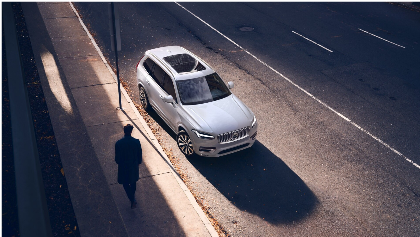
XC90 Bright Вид ззовні

Посилання на дизайн: s.volvocars.com/aJViDUyGv5RzM6HY