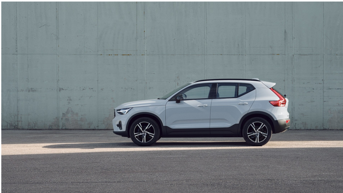
XC40 Dark Вид ззовні